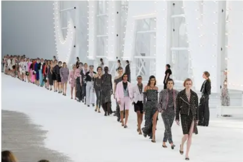
Nearly three quarters of the fashion executives in a survey named generative AI a priority for their companies in 2024.